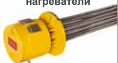
Фланцевые погружные нагреватели