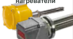
Вкручиваемые погружные нагреватели